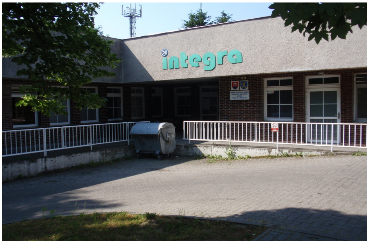
budova DSS v Senci – Lichnerova ulica, súp.č. 155 :